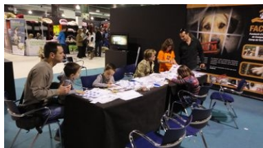
Taller infantil de tinença responsable Fira Bestial 2011

El cap de setmana del 26 i 27 de març es va fer, al nou recinte firal de Reus, la segona edició de la Fira Bestial. La primera fira dedicada als animals de companyia que es fa a les nostres contrades. La nostra fundació va estar present com expositora i es va aprofitar el marc de la fira per realitzar dues desfilades de gossos en adopció, amb la col·laboració dels nostres apadrinadors. També es va realitzar un taller de conscienciació de tinença responsable d'animals de companyia adreçat als nens en un stand paral·lel, que ens va cedir la pròpia fira. Aquest taller era molt semblant al que es va fer a l'última edició del Parc de Nadal de Reus. Finalment vam tenir ocasió, dins de la mateixa fira, d'oferir una xerrada de conscienciació per la tinença responsable, adreçada bàsicament al públic adult.