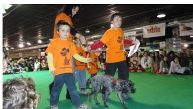
Desfilada de gossos en adopció Fira Bestial 2011