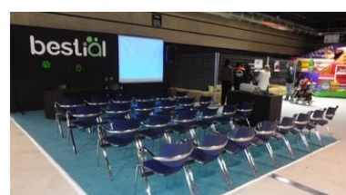
Espai xerrades Fira Bestial 2011

Estem molt satisfets per la presència a la fira Bestial pel que suposa a la promoció de la tinença responsable i al respecte als nostre animals de companyia. També va ser molt positiva la promoció de l'adopció d'animals de companyia procedents de centres d'acollida i protectores, ja que la fira va ser un èxit pel que fa a l'afluència de visitants, segons dades de Fira de Reus, en el transcurs de tot el cap de setmana van visitar la fira aproximadament unes 9.000 persones. Finalment per tancar aquest apartat vull agrair a tots els apadrinadors, col·laboradors i simpatitzants de la nostra fundació, l'ajut prestat, ja que sense vosaltres hagués estat impossible organitzar totes les activitats que es van realitzar a la fira. Moltes gràcies a tots.